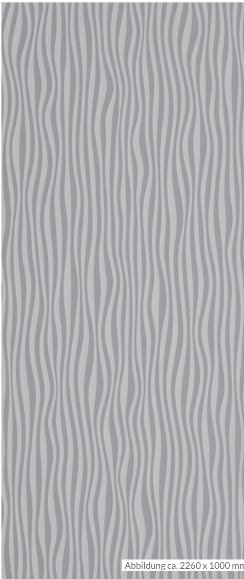
Abbildung ca. 2260 x 1000 mm