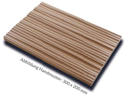
Abbildung Handmuster: 300 x 200 mm