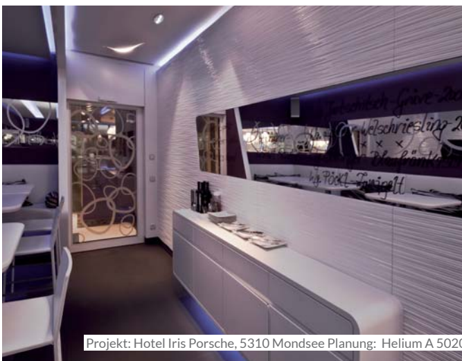
Projekt: Hotel Iris Porsche, 5310 Mondsee Planung: Helium A 5020