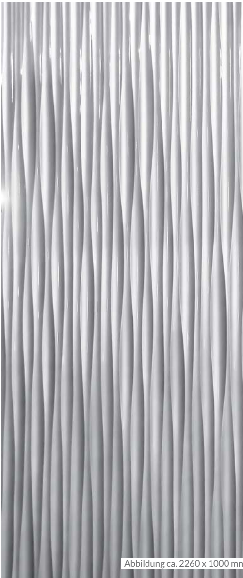
Abbildung ca. 2260 x 1000 mm