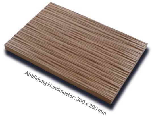
Abbildung Handmuster: 300 x 200 mm