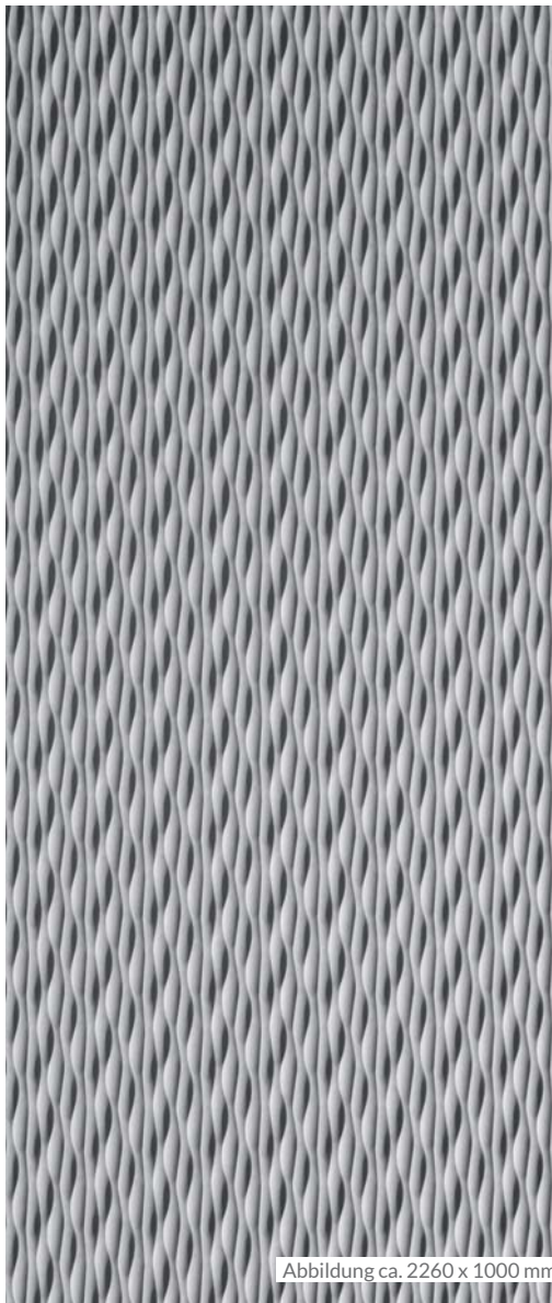
Abbildung ca. 2260 x 1000 mm