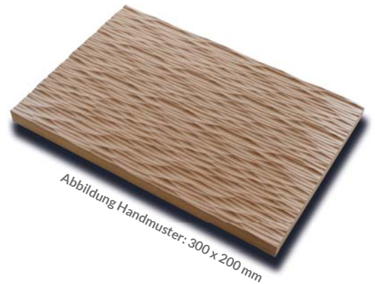
Abbildung Handmuster: 300 x 200 mm