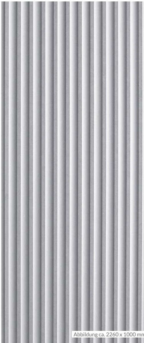
Abbildung ca. 2260 x 1000 mm