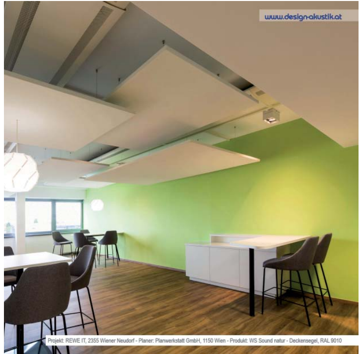
Projekt: REWE IT, 2355 Wiener Neudorf - Planer: Planwerkstatt GmbH, 1150 Wien - Produkt: WS Sound natur - Deckensegel, RAL 9010

Montage: Einhängeleisten / Montagerahmen bzw. Drahtseilabhängiger Akustikleber