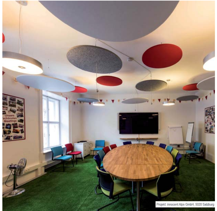
Projekt: innocent Alps GmbH, 5020 Salzburg

Prüfgegenstand: WS Sound nat grau Dicke: ca. 25 mm Prüffläche 8,64m 2 Prüfgegenstand: WS Sound nat Dicke: ca. 40 mm Prüffläche 8,64m 2